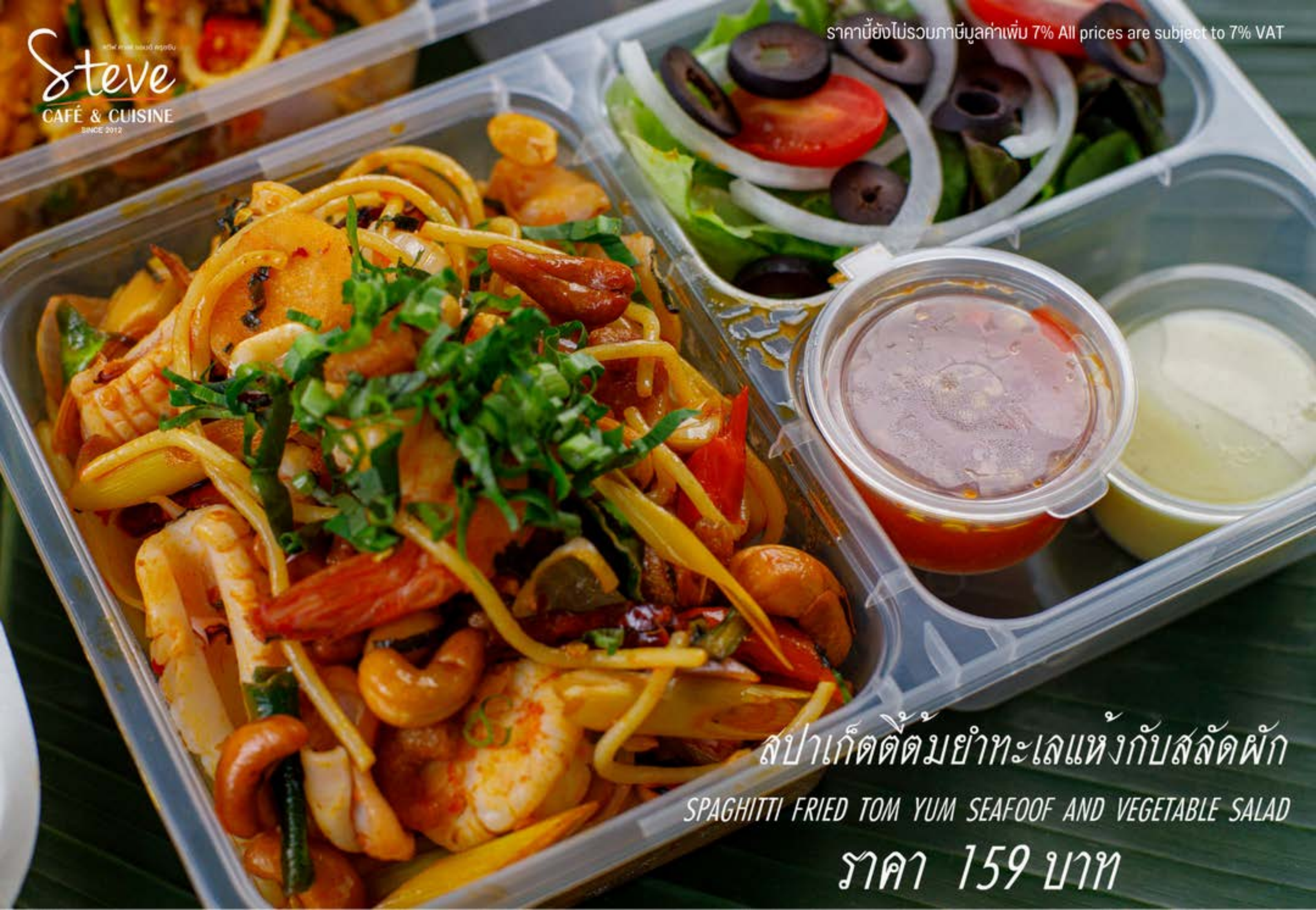
สปาเก็ตตี้ต้มยำทะเลแห้งกับสลัดผัก SPAGHETTI FRIED TOM YUM SEAFOOD AND VEGETABLE SALAD ราคา 159 บาท